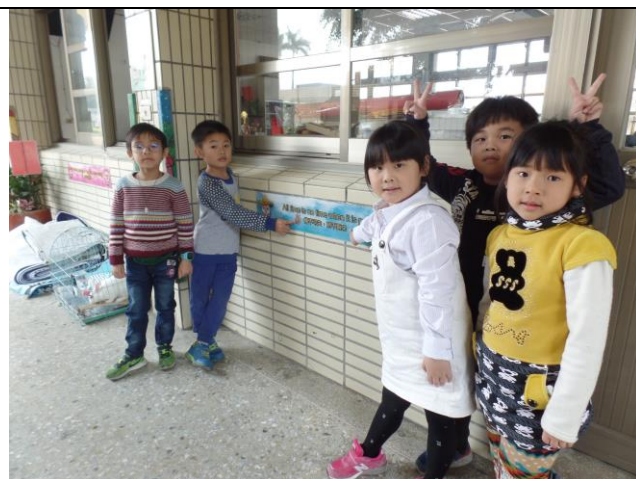
照片說明：文句加上美工設計，吸引學生的青睞，一起來學習。