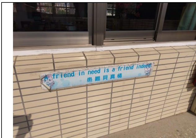
照片說明：走廊邊的佳句日久已損壞剝落(設置前)