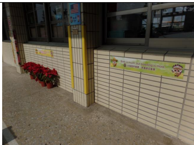
照片說明：進行更新，換上壓克力材質的英語佳句。(設置後)